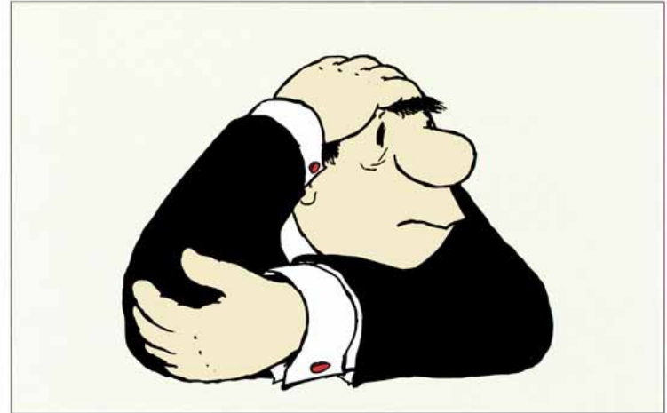
LORIENT-GALERIE NR. 3

Muss zwingend angegeben werden. Andernfalls müsste die KK die Vergütung der „ready to use“-Katheter ablehnen. Allerdings stellt sich die Frage der Umsetzbarkeit; wann besteht beim ISK eine erhöhte Infektionsgefahr?