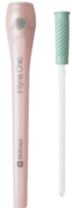
Infyna Chic™ Einmalkatheter

Lesen Sie vor Verwendung die Gebrauchsanleitung mit Informationen zu Verwendungszweck, Kontraindikationen, Warnhinweisen, Vorsichtsmassnahmen und Anleitungen.